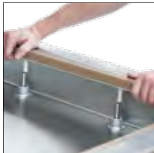
SEALING BAR REMOVAL / SIEGELBALKENS