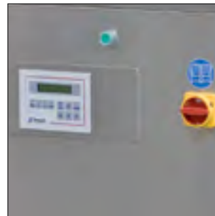
OPERATOR PANEL / BEDIENFELD

In keeping with improvements, designs and specification subject to change without notice. / Die genannten technischen Angaben, sowie die Abbildungen in diesem Prospekt, unterliegen laufender Verbesserungen. Daher sind diese unverbindlich und können ohne vorherige Ankündigung jederzeit geändert werden.